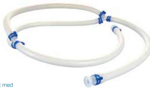
puresu slangesæt med PureWeld XL slanger, BioBarbs og Bio Y

Indgå i et samarbejde med os, så vi kan designe en perfekt tilpasset væskevejsløsning til din applikation.