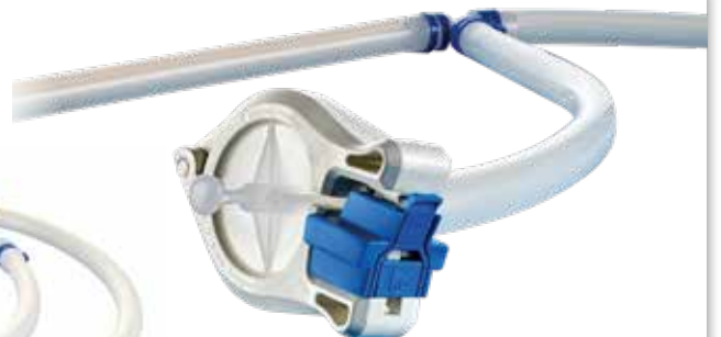
puresu slangesæt med Pumpsil slanger, BioBarb, konnektorer, Platinhærdede silikonepakninger og Q-Clamp sanitær Tri-Clamp